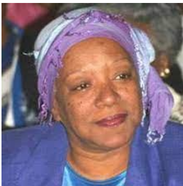
Nancy Morejón (Cuba, 1944)

La poesía de Guillén fue definida por esta autora cubana en estos términos: «Lo que sucede es que el poeta no inventa, sino que desprende de la realidad sus creaciones. Sus criaturas y la problemática de cada una de ellas existen, y él las apresa con garra inolvidable [...]».