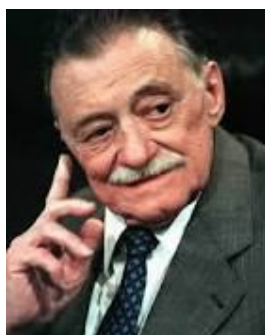
Mario Benedetti (Uruguay, 1920-2009)

Asimismo, la escritora cubana Nancy Morejón ratifica el criterio de Mirta Aguirre en su artículo Introducción a la obra de Nicolás de Guillén , cuando plantea: « En el transcurso de los poemas, Guillén desarrolla, por la palabra poética, sus íntimos conflictos, como antes apunté. La poesía se convierte en el espacio testimonial de su yo vital, comprometido en su yo poético. Así, los poemas que evocan el paisaje del negro en los barrios pobres de la capital forman parte de una secuencia más amplia en la que el yo poético plantea su propio destino ante esas vidas y personajes del pueblo cubano ».