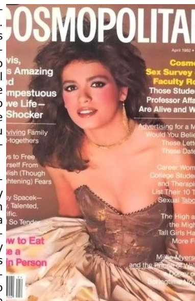
Última portada de Gia Carangi la primera supermodelo

Esto fue un golpe terrible para su carrera. El mundo de la moda es muy hipócrita, las drogas se aceptan sin problemas... siempre y cuando no haya escándalos. Además las drogas volvieron a Gia cada vez más intratable y conflictiva. Llegaba drogada en las sesiones, gritaba a los fotógrafos, agredía a los asistentes, etc. Según dijo Scavullo de una sesión fotográfica "She was crying, she couldn't find her drugs. I literally had to lay her down on her bed until she fell asleep."