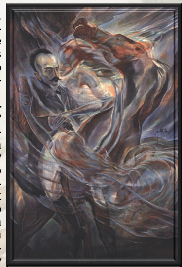
Muerte en dos Ríos,